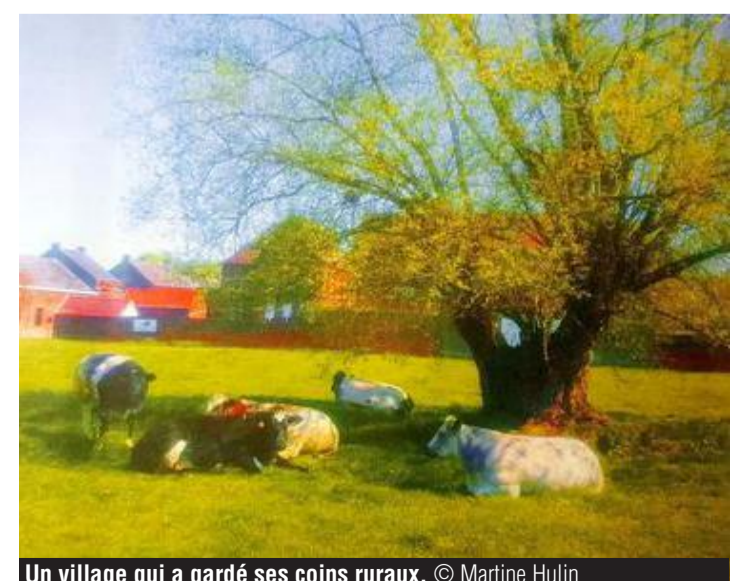
Un village qui a gardé ses coins ruraux.

2015 et que depuis, elle a été rachetée par le Centre Daily Bul de La Louvière. Ce qui constitua un petit fond de roulement pour d'autres initiatives. Avec ce concours photo qui met en valeur un village ou le passé charbonnier se mêle à la nature rurale et à l'âme populaire, nous avons voulu mettre en valeur les Levallois. Des gens modestes, profonds et très chaleureux. C'est notre trésor. ●