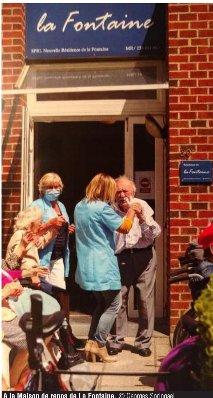
A la Maison de repos de La Fontaine.