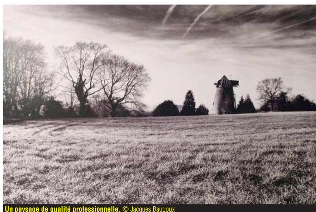
Un paysage de qualité professionnelle.