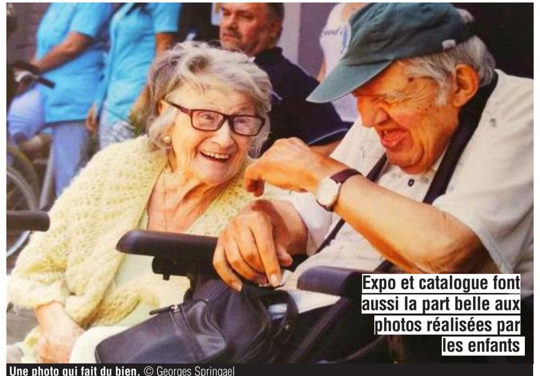
Une photo qui fait du bien.

Le président du jury aurait bien aimé plus de clichés mettant en scène des personnes de manière authentique. Des tranches de