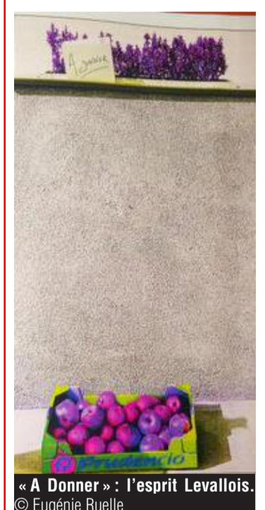
« A Donner » : l'esprit Levallois.